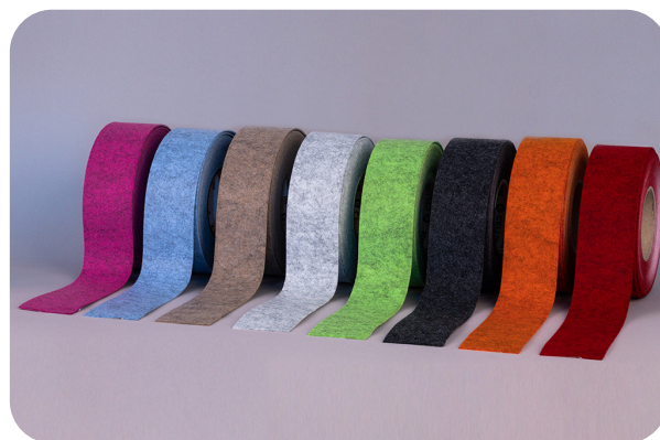
Rubans adhésifs de feutre soni VLD